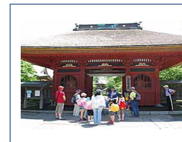
神社とお寺が一つとなった飯縄寺を見学