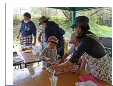
石窯料理のつとめ①(ヒリ作り) 4月13日