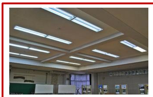
25年度は講堂、通路、厨房の照明をLEDに。所内のLED照明は200本を超えました。