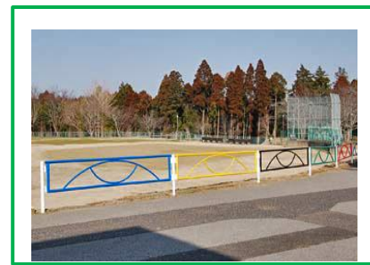
オリンピック色にしたガードレール。