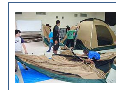
子どもキャンプ①(雨のため室内にテント張り) 6月7,8日