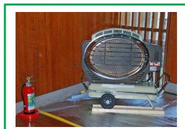
体育館に大型石油ヒーターを追加。