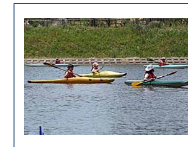
カヌー体験教室①(栗山川で) 5月11日