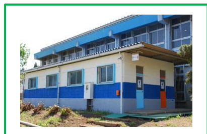
外トイレ・倉庫の外装を明るく。