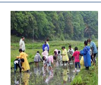
有機の田んぼで田植え 日