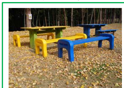
キャンプサイトの新しい椅子。