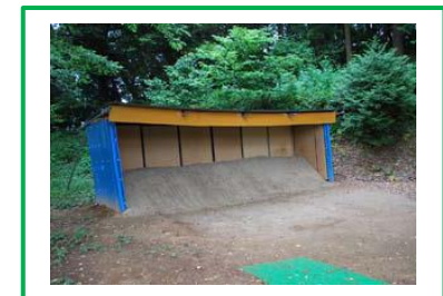
一新した弓道練習場。