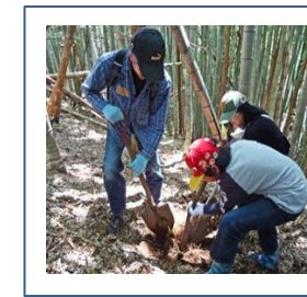
タケノコ掘りをしよう 今年度は親子の参加とした 4月26日