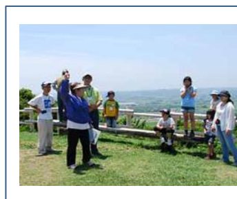
太東岬を歩こう 太東岬の海蝕などの話を聞く