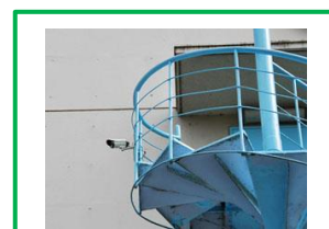
防犯カメラを設置。事務室で監視します。