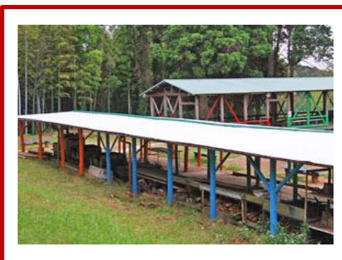
ピザ焼の石窯がある釜場の屋根を張り替え、一部、柱も交換しました。