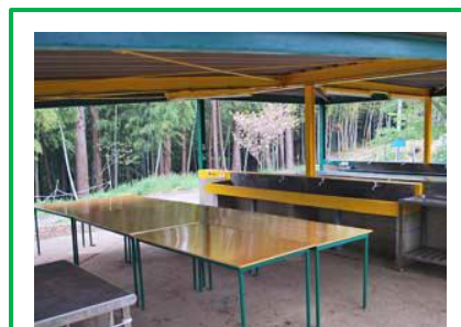
雰囲気の良い炊飯調理場。