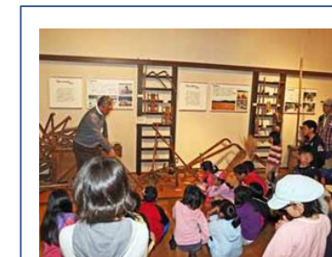
お米の世界① 佐倉・和田資料館で農業の歴史を